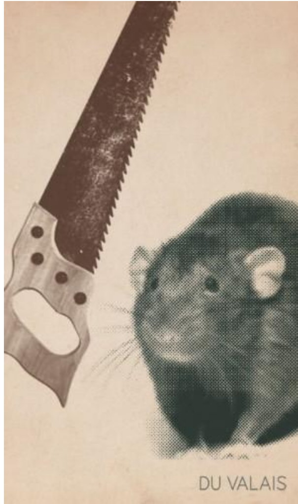
SYRAH: Shep Proudfoot